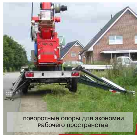
поворотные опоры для экономии рабочего пространства