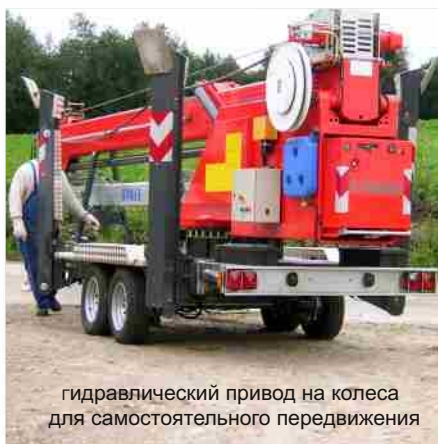
гидравлический привод на колеса для самостоятельного передвижения