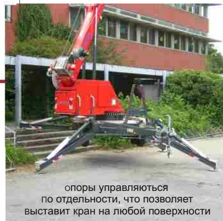
опоры управляются по отдельности, что позволяет выставить кран на любой поверхности