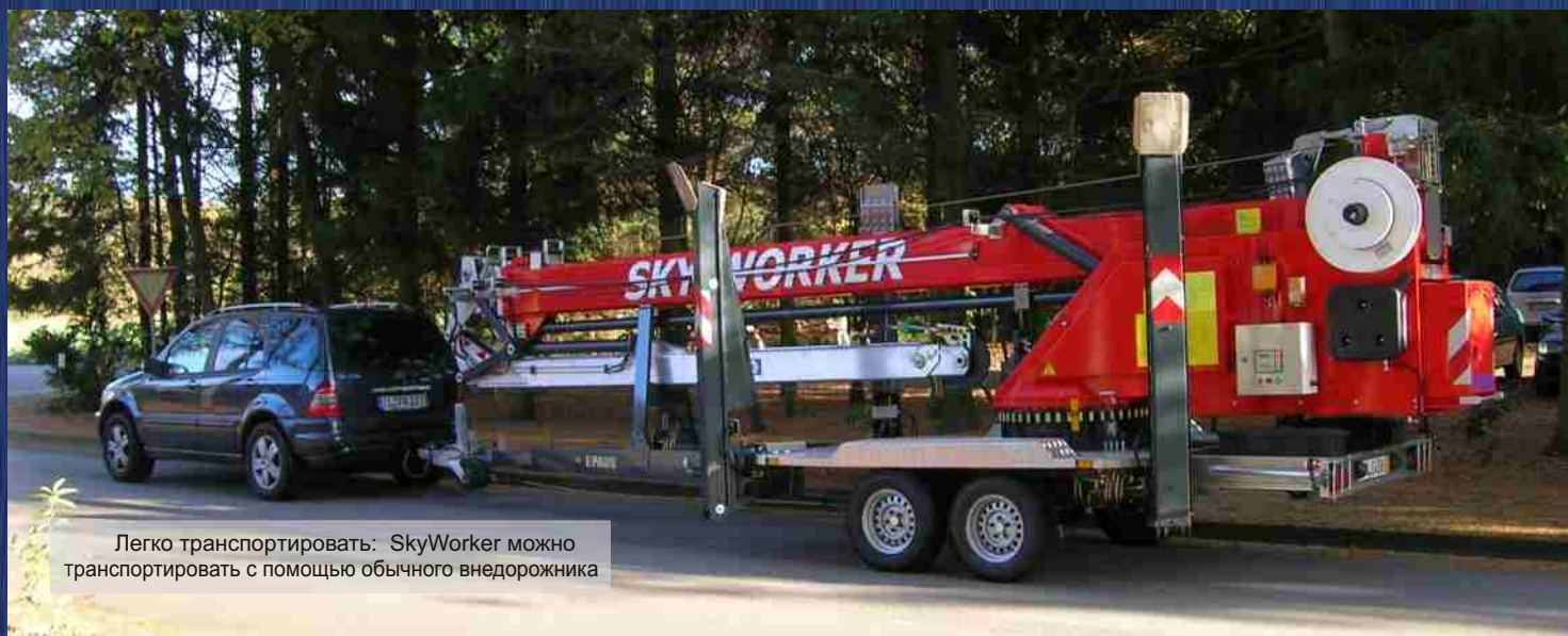
Легко транспортировать: SkyWorker можно транспортировать с помощью обычного внедорожника

Наши машины соответствуют всем последним Европейским требованиям безопасности. Мы оставляем за собой право на технические изменения.