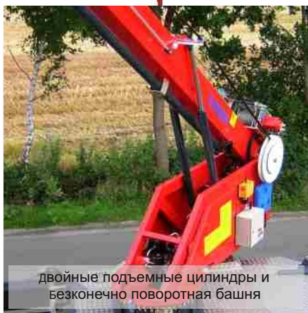
двойные подъемные цилиндры и бесконечно поворотная башня