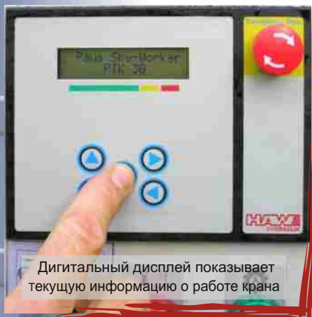
Дигитальный дисплей показывает текущую информацию о работе крана